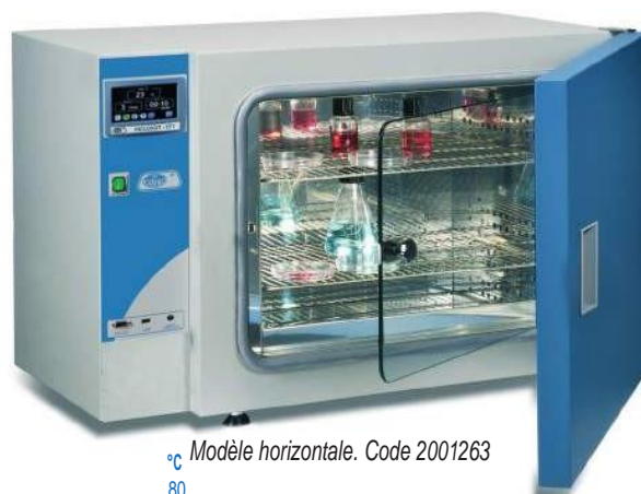
Modèle horizontal. Code 2001263